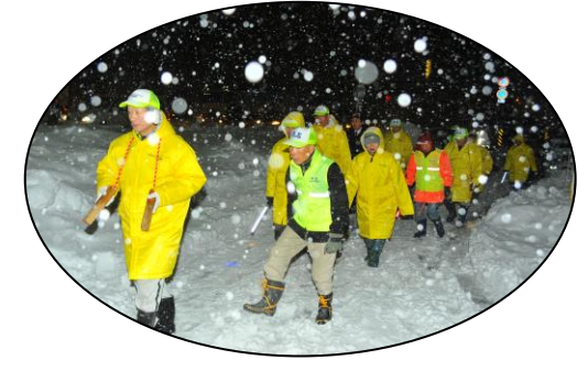
蒲原町内会防犯・防火パトロール隊