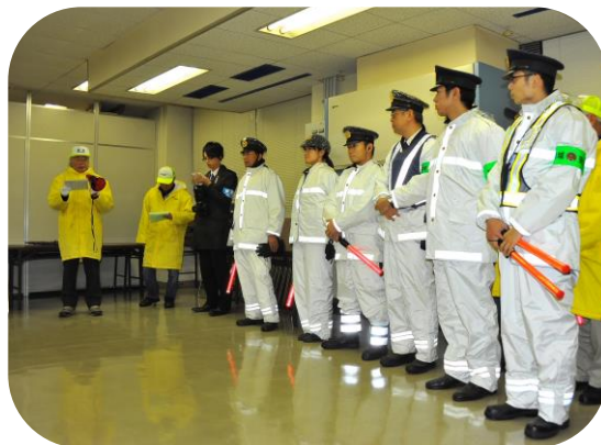
沼垂交番2名 駅前交番1名 東警察地域課3名 今回女性警官も参加