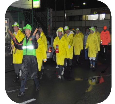
拍子木に合わせて1・2・3