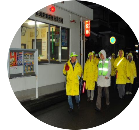
交番の前もパトロール