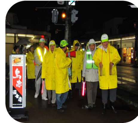
拍子木合わずにチョット打ち合わせ