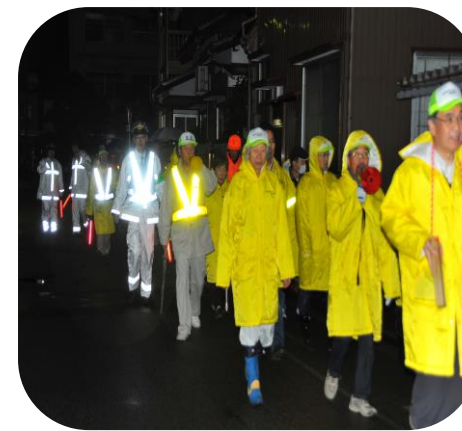
警察官も一緒にパトロール