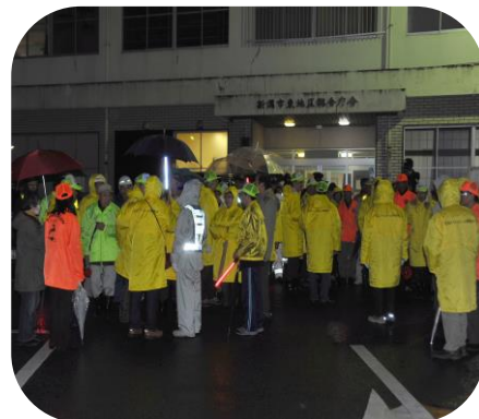
雨の中にもかかわらず多くの方々の参加 パトロール イザ 出発!