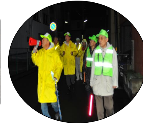
大きな掛け声「戸締り用心火の用心」