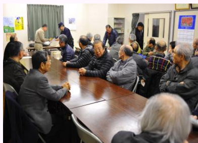
30余名の参加者からは活発な質疑応答があり、有意義な座談会となりました