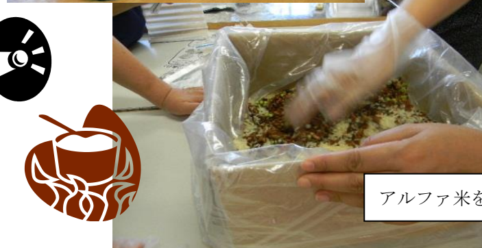
アルファ米を使った炊き出し訓練