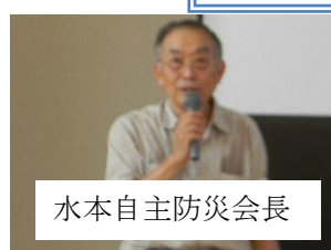
水本自主防災会長