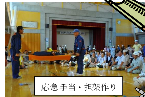
応急手当・担架作り