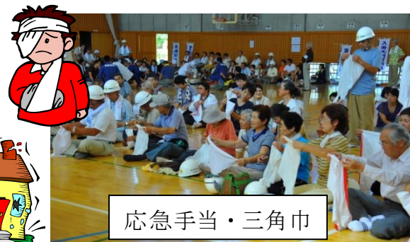
応急手当・三角巾