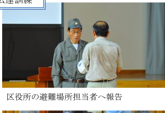
区役所の避難場所担当者へ報告