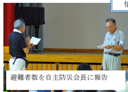
避難者数を自主防災会長に報告