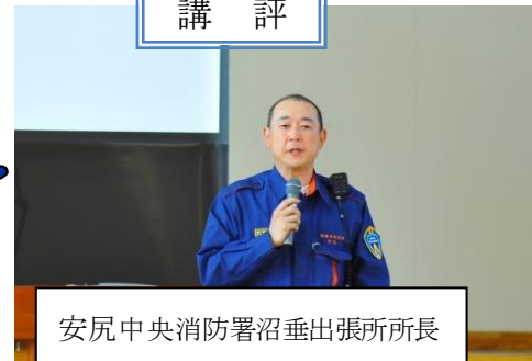
安尻中央消防署沼垂出張所所長