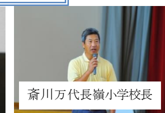
斎川万代長嶺小学校長