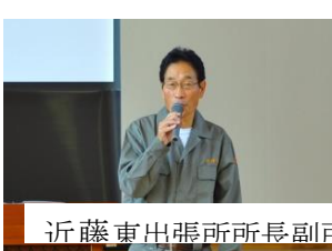
近藤東出張所所長副所長