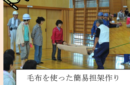
毛布を使った簡易担架作り