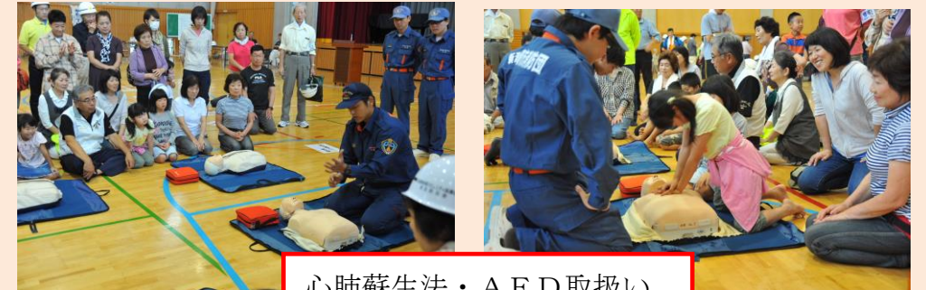
心肺蘇生法・AED取扱い