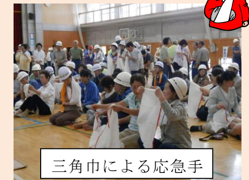
三角巾による応急手