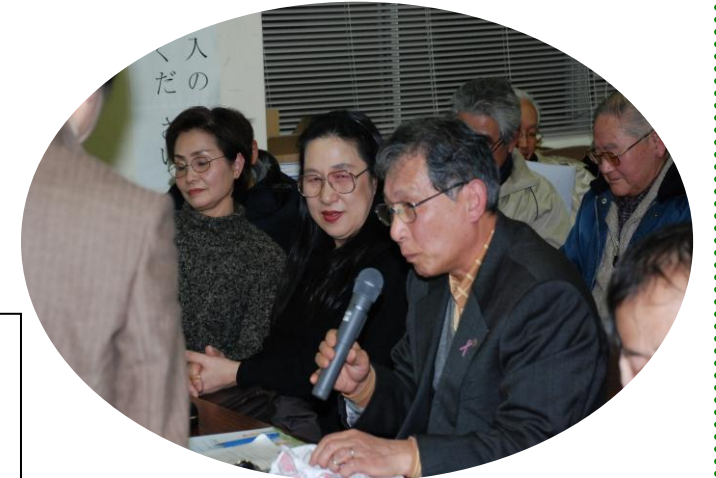
中央区内で長嶺コミ協は女性役員の割合1位