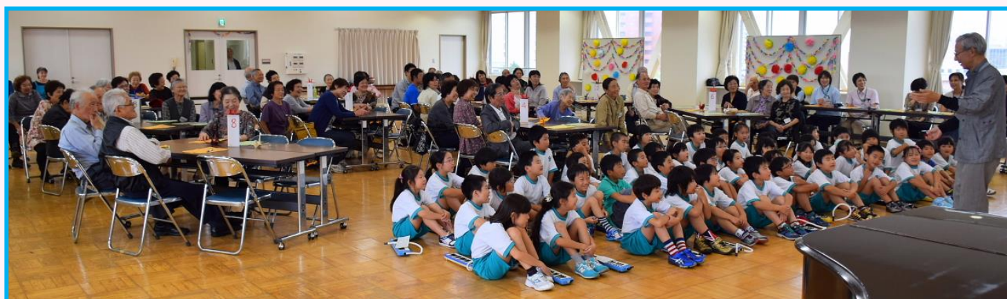
ご参加いただいた地域の皆さんと万代長嶺小学校2年生の皆さん

ふれあい給食さんには4月に試食会にお伺いさせて頂きまして、とても優しい味で美味しくて、すごく心が癒された事を覚えています。今日の給食会も楽しみにしております。