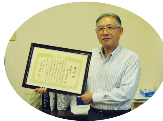
大竹長嶺地区防火連合会長と千日間無火災で戴いた榮譽ある表彰状です。