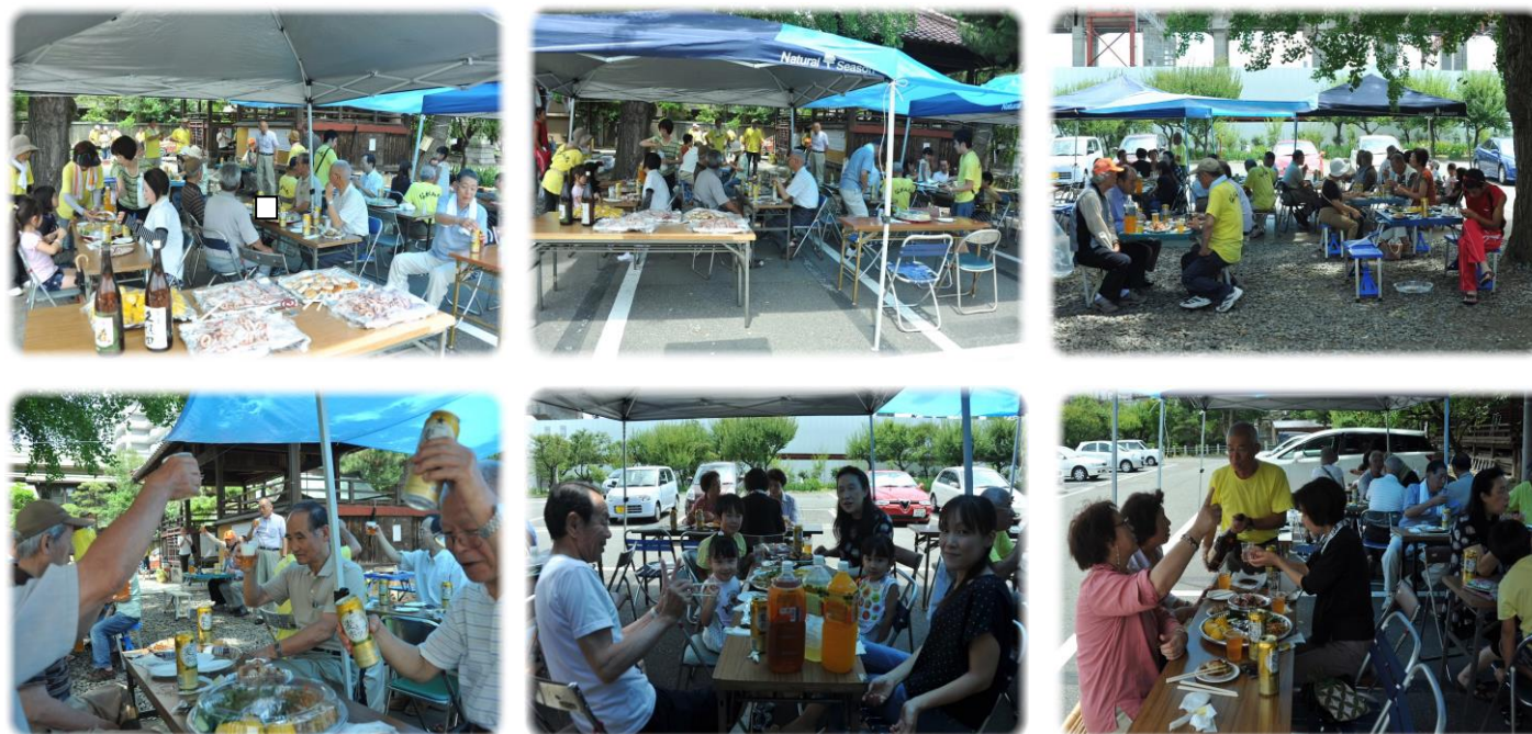
美味しい料理に舌つづみを打ちながら楽しい会話ははずみずみ