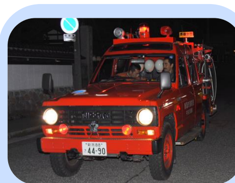
毎月第二水曜日に消防車による防火広報をする消防団のみなさんです。