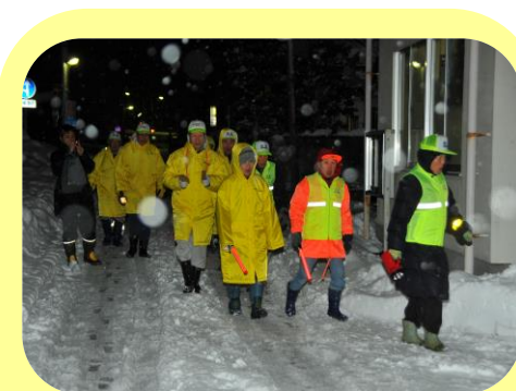
各自治会町内会による毎月三回の防犯防火パトロールの様子です。