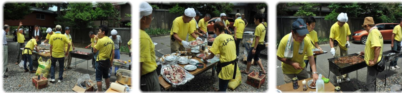
炎天下の元 スタッフからホタテやイカ・肉を調理して頂きました