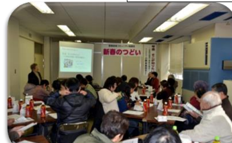
気になる支給開始年齢や遺族年金などなど、とても勉強になりました。