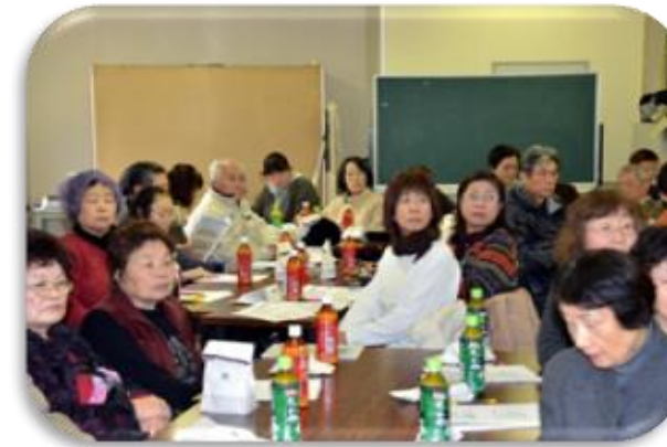
身近なテーマだけに、真剣な表情