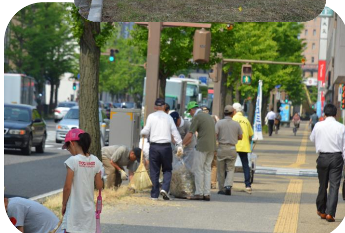
ほんぽーと来館者が気持ち良く来て頂くため、今年も80名余りで心こめての清掃活動でした