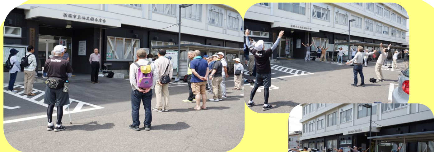
出発セレモニーの後ラジオ体操をして体をほぐしました