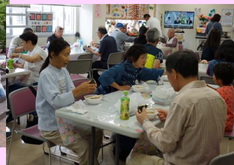
11 時 15 分帰路に着きました。美術館では一時間足らずの鑑賞でしたが有意義な元気ウォークでした。12 時過ぎには全員で美味しいトン汁をいただき心地よい疲れもいやされました。