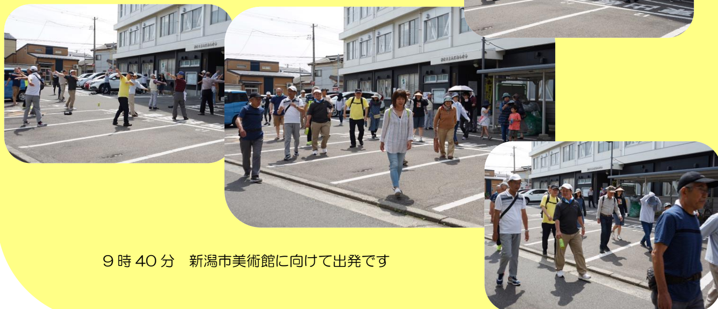
9 時 40 分 新潟市美術館に向けて出発です