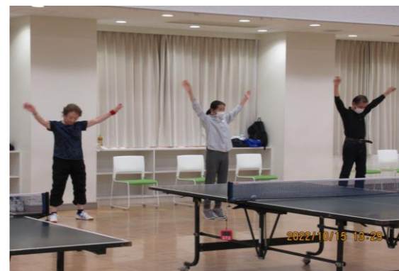
参加者全員でラジオ体操