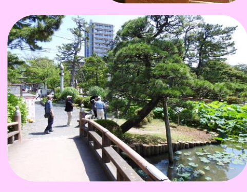
10時白山神社に到着しました。ハスの花の開花には少し早かったようです。