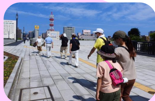
万代町通りから APA HOTEL の前を通り万代橋を渡ります