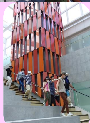
古町ルフルの前でしばし休憩をして西堀ローサに向かう階段を下ります。