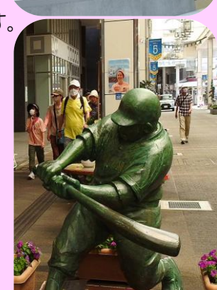
西堀ローサを上がり新津屋小路を通り、古町モールの「ドカベン像」の脇を歩きます。