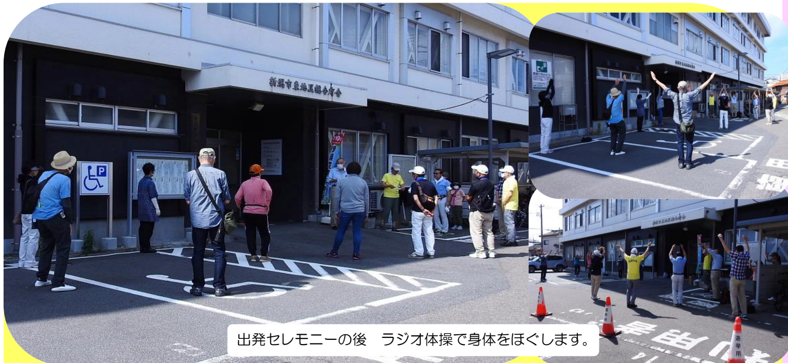
出発セレモニーの後 ラジオ体操で身体をほぐします。