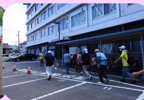
「りゅーとぴあ」の屋上展望回路を散策し、やすらぎ堤を通り東出張所に到着しました。